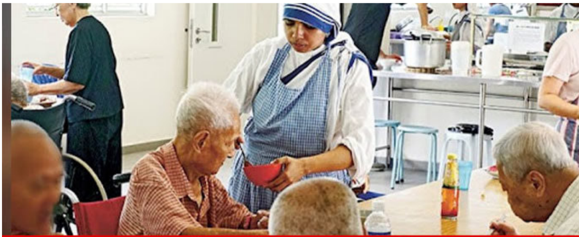
അഗതിമന്ദിരങ്ങളിലെ അന്തേവാസികളോട് സർക്കാരിന്റെ ക്രൂരത; ഇനി അവർക്ക് പെൻഷനില്ല

അഗതിമന്ദിരങ്ങളിലെ അന്തേവാസികൾക്ക് അർഹതയില്ലെന്ന് സർക്കാർ ഉത്തരവ്. ധനവകുപ്പിന്റെ ഉത്തരവ് പുറപ്പെടുവിച്ചിട്ടുള്ളത്. 2016 ജനുവരിയിൽ ധനവകുപ്പിന്റെ ഉത്തരവ് പുറപ്പെടുവിച്ചിട്ടുള്ളത്.