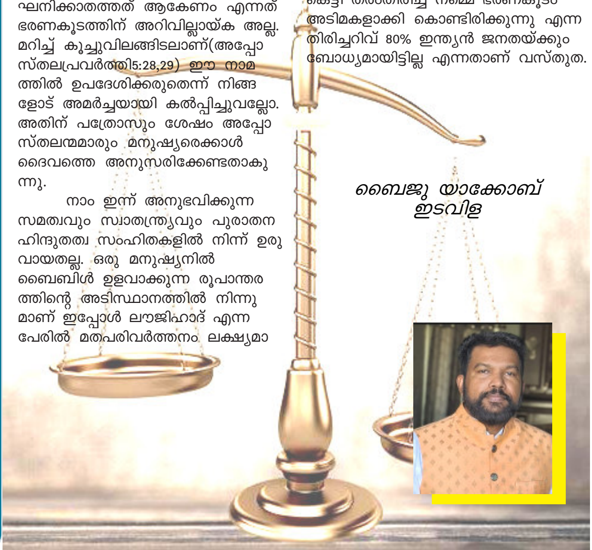
ബൈബിൾ യാക്കോബ് ഇടവിള

സ്യൂഡനിലെ ഡംഇൻസ്റ്റിറ്റ്യൂട്ട് മാർച്ച് 2021 ലെ റിപ്പോർട്ട് പ്രകാരം ഇന്ത്യ തിരഞ്ഞെടുക്കപ്പെട്ട സോഷ്യാലി പത്യ രാജ്യത്തിലും അമേരിക്കയുടെ ഫ്രീഡം ഓഫ് ദി വേൾഡ് 2020 ലെ റിപ്പോർട്ടിൽ ഇന്ത്യ ഇന്ന് ഭാഗികമായി മാത്രം സ്വാതന്ത്ര്യം അനുഭവിക്കുന്ന രാജ്യം എന്നുമാണ് പഠനങ്ങൾ വെളിപ്പെടുത്തുന്നത്. ഇന്ത്യ എന്ന സെക്കുലർ സ്റ്റേറ്റിൽ നിന്നും മതത്തിന്റെ വേലി കെട്ടി തരംതിരിച്ച് നമ്മെ ഭരണകൂടം അടിമകളാക്കി കൊണ്ടിരിക്കുന്നു എന്ന തിരിച്ചറിവ് 80% ഇന്ത്യൻ ജനതയ്ക്കും ബോധ്യമായിട്ടില്ല എന്നതാണ് വസ്തുത.